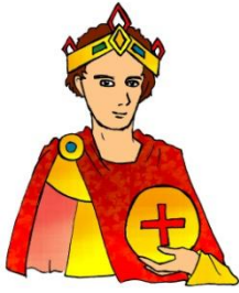
Kaiser Otto II römisch-deutscher Kaiser (*955 - †983)

Kaiser Otto II. schenkte 983 Erzbischof Willigis von Mainz als Dankeschön für seine Dienste das gesamte Reichsgut Bingen und den Rheingau. Somit fiel auch das Erzstift in Bingen mit der Kirche an das Bistum Mainz.