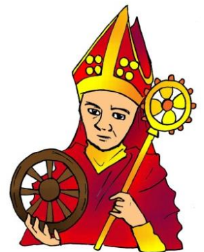
Willigis Erzbischof von Mainz (*940 - †1011)