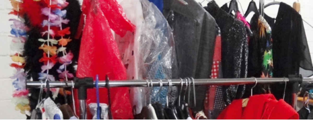
Fastnachtskostüme tauschen am Kleidertausch-Tag im Umweltladen