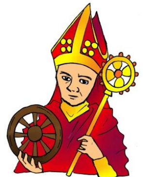
Willigis Erzbischof von Mainz (*940 - †1011)

Mit dem Zugewinn von Bingen erhielt Willigis, der Erzbischof von Mainz, einen damals wichtigen verkehrspolitischen Punkt: Sowohl die Rheinstraße von Mainz nach Koblenz als auch die Straße von Mainz nach Trier verliefen durch dieses nun neu erworbene